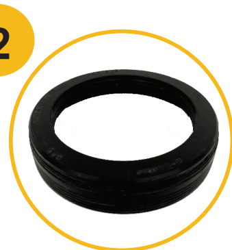
07338-H1HEB (e-Barrier 809)