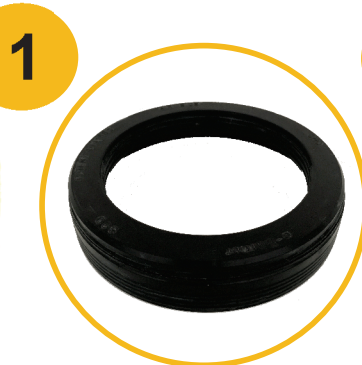
CH0503-N10 (e-Barrier 704)